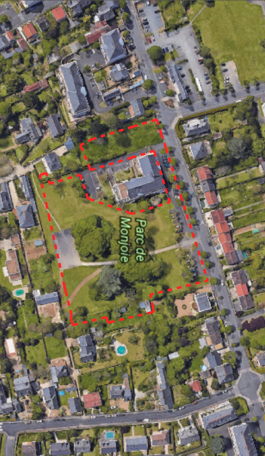
Extrait de photo aérienne

Parcelles concernées par l'opération : AV 27, AV 28, AV 63, AV 317, AV 451, AV 488, AV 469